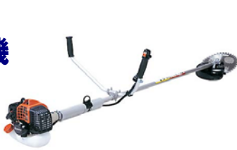
共立 SRE2355UG 37,800円 ECOエンジン搭載のGoGo刈払機