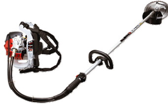
ゼノア BK2650EZ 85,470円 使いごち抜群のクルクルカッター