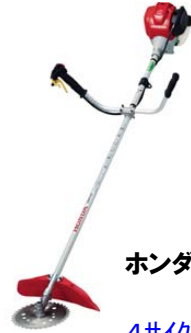
ホンダ UMK425 59,325円 4サイクルエンジン搭載機