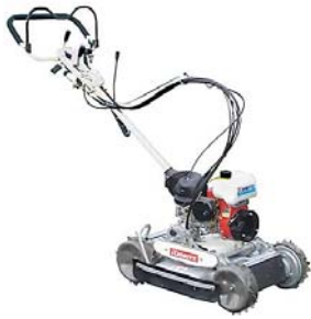
ホンダ草刈機 UM2160 205,065円 広い面積の雑草刈りに最適の草刈機