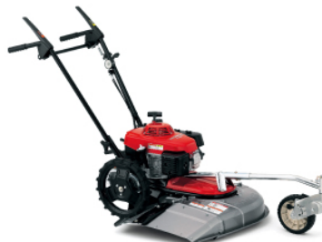
ホンダ芝刈機 HRG415 103,425円 家庭用のエンジン自走芝刈機